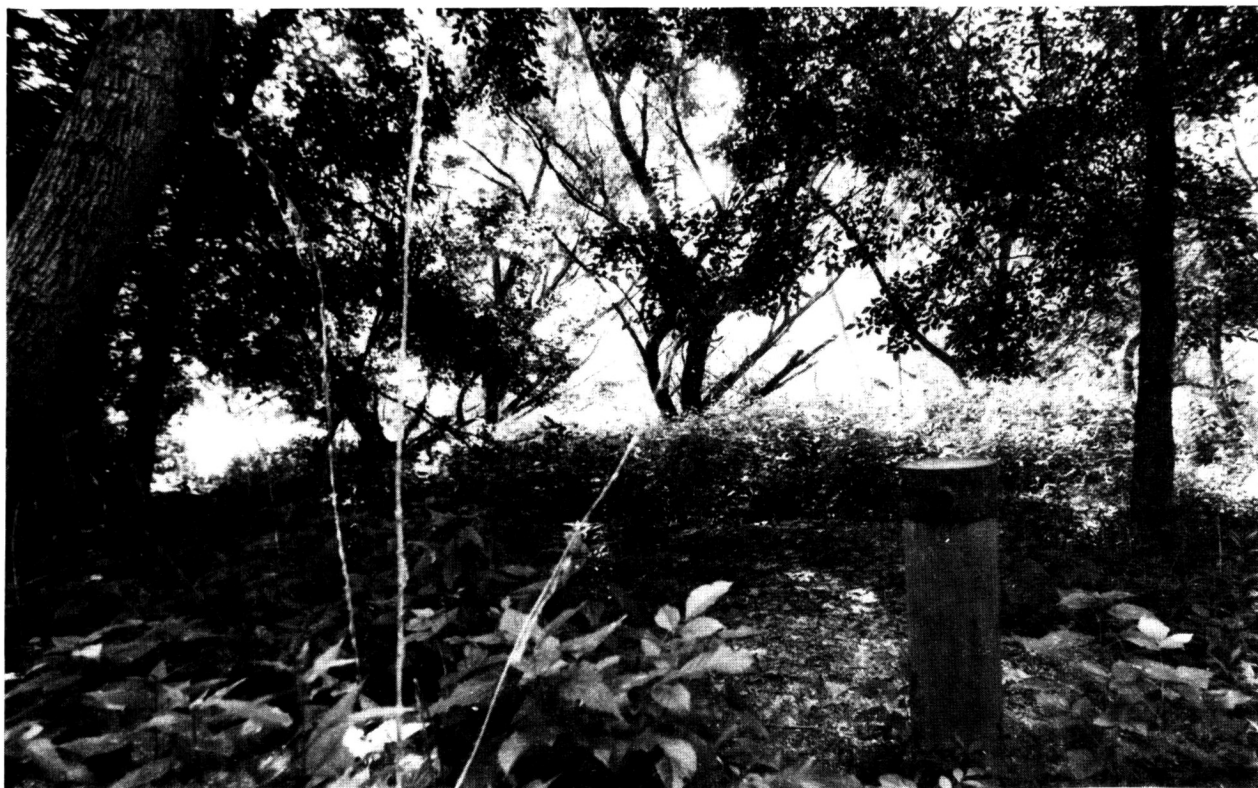
Monitorovacia lokalita č. 14 Istragov