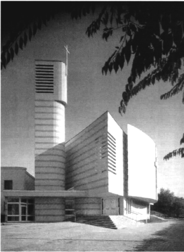
Nový kostol Saleziánov don Bosca na rohu Miletičovej a Záhradníckej ulice v Bratislave

záhuby ľudstva? O takýchto smutných prognózach sa píše ako o reálnej možnosti. Na túto možnosť upozorňuje napríklad nositeľ Nobelovej ceny zoológ Konrad Lorenz. V knižočke 8 smrteľných hriechů napísal: “Keď civilizované ľudstvo v slepom vandalizme ničí živú prírodu, ktorá ho obklopuje a živí, ohrozuje samo seba ekologickým zruinovaním. Svoju chybu si začne zrejme uvedomovať až keď ju pocíti ekonomicky, ale to už bude akiste neskoro. Najmenej zo všetkého si všíma to, ako veľmi poškodzuje tento barbarský proces jeho myseľ. Všeobecne a rýchlo sa šíriace odcudzenie civilizovaného človeka od živej prírody má veľký podiel viny na jeho vzrastajúcom estetickom a etickom úpadku.” Na poplach bije Konrad Lorenz aj v iných svojich knihách, a s ním mnohí ďalší.