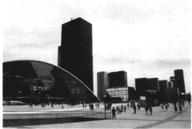
Paríž (La Défense) – budúce miesto nového kostola Notre-Dame de Pentecôte

Zodpovednosť pred Bohom za zverené hodnoty akéhokoľvek druhu vykreslil Ježiš v podobenstve o talentoch (Evanjelium podľa Matúša, 25. kapitola). Obsah podobenstva je jednoduchý: Bohatý človek pred svojim odchodom na cesty zveril svojim sluham veľké finančné hodnoty, aby ich zveľaďovali. Pri svojom návrate ich volá na zodpovednosť, ako naložili s tým, čo im dal na starosť. Pochválení a odmenení sú tí, ktorí konali podľa inštrukcií svojho pána, kritizovaný a potrestaný je ten,