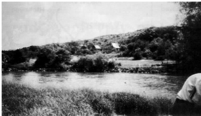
Miesto situovania vodného diela Dolný Čepeň pri riečnom variante. V pozadí osada Poradič.

pokladaných vplyvov výstavby a prevádzky VD Sereď–Hlohovec na životné prostredie.