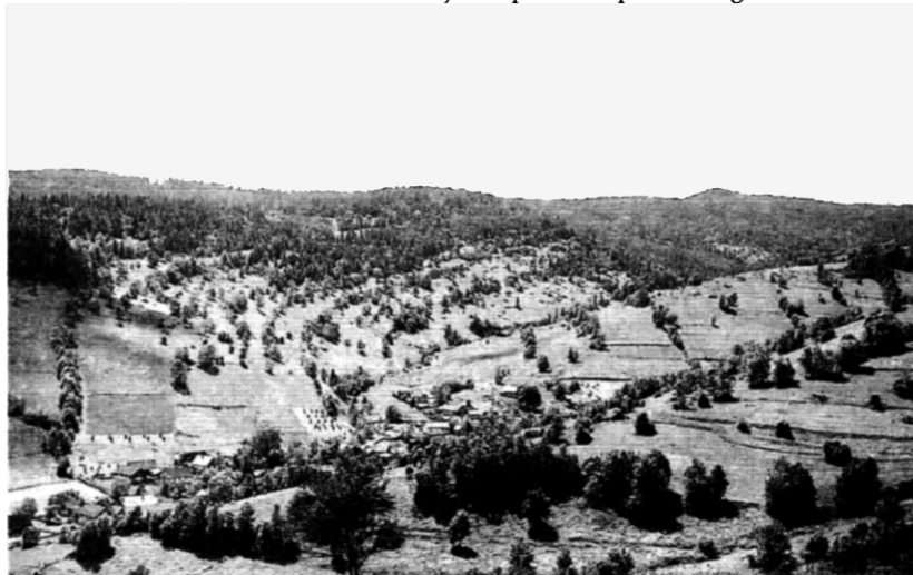
Malá Franková – obec ležiaca v severnej časti pohoria Spišská Magura

vej optimalizácie vybraných socioekonomických činností so zameraním na poľnohospodárstvo a cestovný ruch. Čiastkové výsledky výskumu, ako aj výskumu vývoja druhotnej krajinnej štruktúry, boli prezentované v katastroch obcí Malá Franková a Osturňa. Obce ležia v koncových údoliach severnej časti pohoria Spišská Magura. Najmä pre nepriaznivé pôdno-klimatické podmienky a zlú dostupnosť do ekonomických centier regiónu sa tu neuskutočnilo tzv. sceľovanie pozemkov v rámci kolektivizácie. Spomalený vývoj obcí sa odrazil v značnom zachovaní pôvodnej architektúry domov, ako aj pozemkového členenia poľnohospodárskej krajiny. Sedem km dlhá obec Osturňa bola vyhlásená za rezerváciu ľudovej architektúry, najväčšiu na Slovensku. Obce boli založené v 15. a 16. storočí, v období dosídľovania regiónu tzv. lazovou kolonizáciou. Obyvatelia sa živili ovčiarstvom, dobytkárstvom, poľnohospodárstvom a drevorubačstvom. Odlišná intenzita rozvoja oboch obcí je hlavnou príčinou odlišnej štruktúry členenia poľnohospodárskej krajiny. Osturňa bola v predvojnovom období najvýznamnejším stredis-