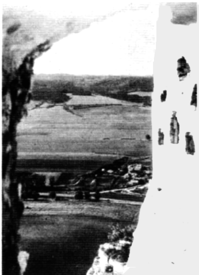
Výhľad zo Spišského hradu

kom ovčiarstva na Zamagurí. Jej intenzívnejší rozvoj sa odrazil na tvorbe hustej pásovej štruktúry pozemkov. Malá Franková sa rozvíjala pomalšie a širšie pásy pozemkov boli vhodné aj na orbu po vrstevnici. Členením pásov pozemkov po vrstevnici sa vytvorila bloková štruktúra pozemkov. V období socializmu v obciach neboli JRD, preto boli na pokraji záujmu štátu. Neskôr sa v dôsledku centralizácie štátnej správy obce zlučovali a riadene zanikali (v dôsledku stavebnej uzávery, zrušenia vybavenosti, zastavenia výstavby infraštruktúry a pod.). Obe obce pre nedostatok pracovných príležitostí v bližšom okolí zaznamenávajú dodnes silný úpadok.