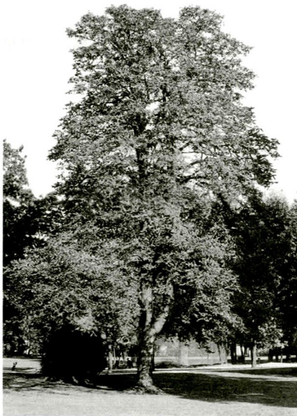
1. Pagašťan konský neošetrený so zaschnutými listami