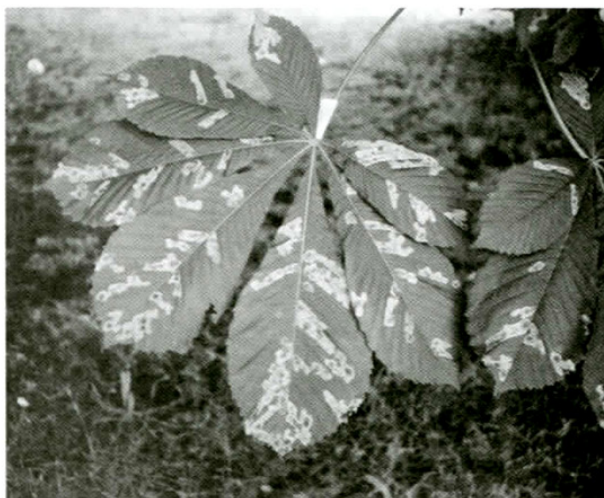
3. List napadnutý larvami prvej generácie ploskáčika pagašťanového

Tento systém ochrany pomáha potlačiť výskyt imág a zároveň eliminuje rezervoár pôvodcov hubových