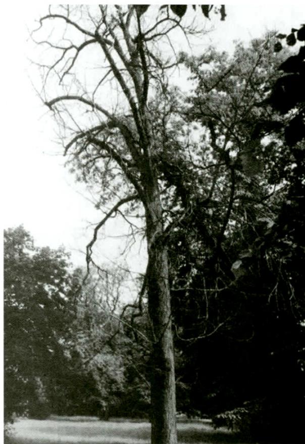
4. Pagašťan konský neošetrený, napadnutý fytopatogénnou hubou Guignardia aesculi