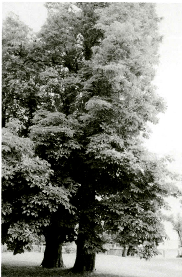
6. Pagaštan konský ošetrený 5. 5. 1999 – stav k 30. 9. 1999

ochorení listov pagaštana konského. Postačuje na reguláciu početnosti škodcu pod hranicu jeho hospodárskej významnosti v prípadoch, keď sú kmene stromov pagaštana konského obklopené tvrdším podkladom bez rastlinného podrastu (napr. aleje pozdĺž ciest v mestských aglomeráciách alebo solitéry pri kaštieľoch, kostoloch, železničných staniach a pod.).