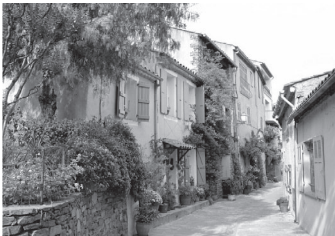
Európska krajina: (Francúzsko) Provencálska mestečká a dedinky hýria všetkými farbami. Ulička v Bormes les Mimosas (hore), typické porasty korkového duba v okolí Col du Canadel (dolu).

Ochrana voľnej krajiny a vodných zdrojov tvorí významnú súčasť dokumentu Európskej komisie EUROPA 2000+ (1994). Aj tento rozsiahly analytický a sčasti prognostický materiál venuje osobitnú pozornosť opätovnému vytvoreniu ekologických koridorov a ich integrácii do plánovacej dokumentácie. Ďalej sa venuje rekreačnej funkcii voľných priestorov a možnostiam cezhraničnej spolupráce pri správe veľkopriestorových chránených území. Odvoláva sa pritom na Smernicu Rady č. 92/43/EHK o ochrane biotopov, voľne žijúcich živočíchov a voľne rastúcich rastlín, na Nariadenie č. 92/2078/EHK na podporu ekologicky únosných poľnohospodárskych produkčných metód, na Nariadenie č. 92/2080/EHK o spoločnej podpore zalesňovacích aktivít pri renaturalizácii poľnohospodárskej pôdy, ako