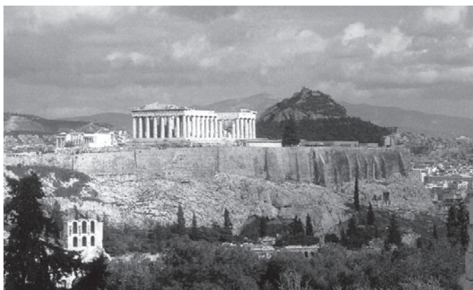
Európska krajina: (Grécko) Pohľad na Akropolu v Aténach.

V oblasti priestorového plánovania neexistuje na úrovni EÚ záväzná právna úprava. Problematika priestorovo relevantných plánovacích aktivít je rozdelená medzi jednotlivé odvetvia. Obsahuje ju poľnohospodárska politika, dopravná a infraštruktúrna politika i environmentálna politika. Je potešujúce, že v plánovacích dokumentoch týchto sektorov je aktívne podchytené aj krajinné plánovanie. V procese aproximácie práva SR bola snaha cieľavedome sledovať túto oblasť a v integrovanej polohe ju legislatívne zabezpečiť. Nesystémové kroky v legislatíve o územnom plánovaní alebo iných zákonných normách, nech sú motivované akokoľvek, môžu narobiť viac škody ako úžitku. Poloha krajinného plánovania a ochrany a tvorby krajiny v dokumentoch Európskej únie jednoznačne poukazuje na potrebu koordinovaného integrovaného prístupu krajinného a územného plánovania. Ekologicky únosné funkčné využitie krajinného priestoru je imperatívom vyplývajúcim z podstaty cieľov priestoro-