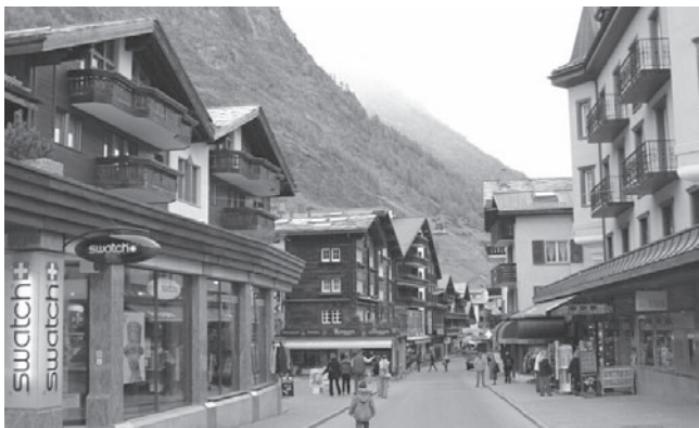
Európska krajina: (Švajčiarsko) Aplská dedinka Zermatt kde je doprava povolená len pre špeciálne vozidlá, prevažne s elektrickým pohonom.

štruktúr, keďže krajina ako dôležitý faktor prostredia človeka prispieva k vytváraniu lokálnych kultúr a je hlavnou súčasťou európskeho kultúrneho a prírodného dedičstva. Okrem toho je krajina základným prvkom životného prostredia, hrá dôležitú úlohu verejného záujmu v kultúrnom, ekologickom i sociálnom ohľade a je aj ekonomickým zdrojom.