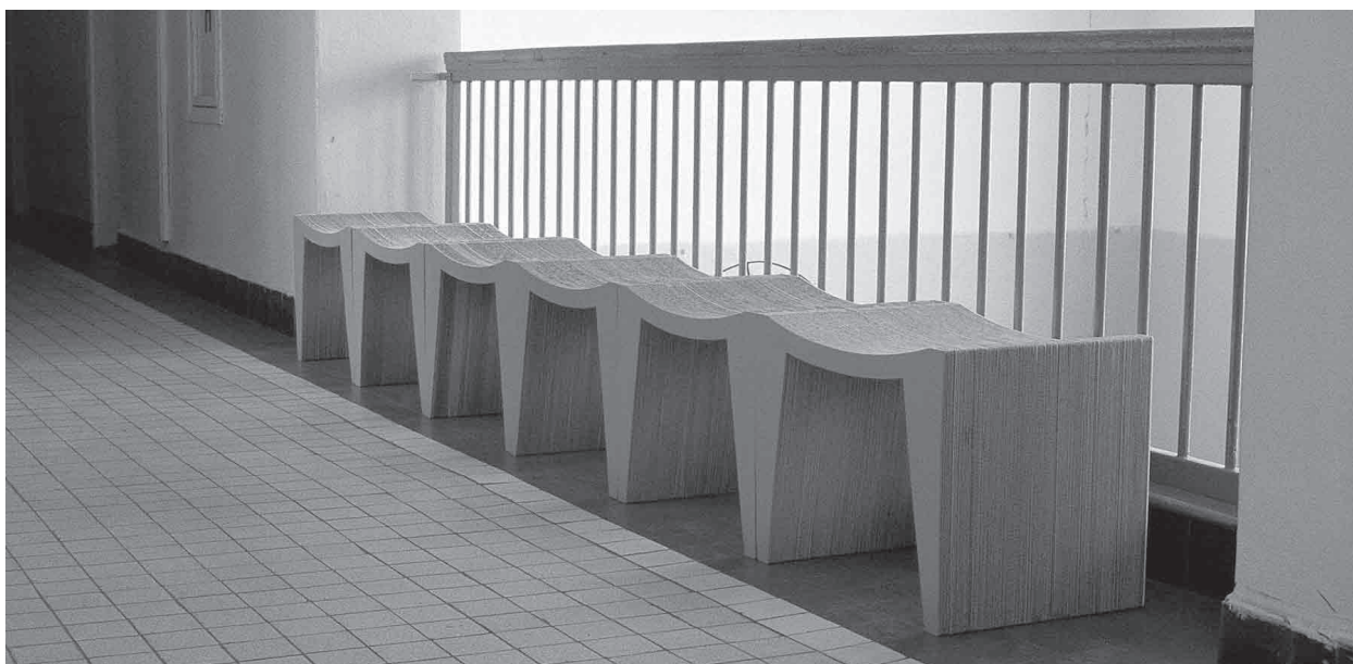
Znásobením prvkov vedľa seba vytvoríme rytmizovanú lavicu s modulom sedenia 600 mm

šenia, bohaté na nové konštrukčné princípy, ale bez mimoriadneho uplatnenia v praxi. Na trh sa dostali prvky vyseknuté z jedného plátu vlnitej lepenky a formované prelamovaním, pričom vzniknuté lomenice sa fixovali vlastnými záložkami alebo prepichnutím dreveným prútom. Tento jednoduchý dizajn umožňujúci prepravovať nábytok v dvojrozmernej forme vniesol novú kvalitu do názoru na výzor papierového nábytku.