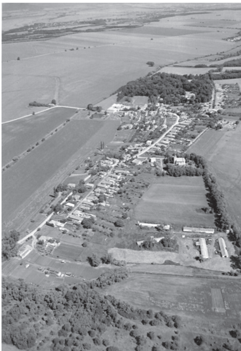
Príklad lokalizácie historického parku v poľnohospodárskej krajine (Tajná pri Vrábľoch).

Z najstaršieho stredoveku už dnes nenájdeme na našom území živé príklady formovanej vegetácie. Vierohodné správy dokumentujú existenciu kláštornej záhrady v Červenom Kláštore (založenej r. 1319) pri Dunajci, kde sa pestovali liečivé rastliny pre potreby nemocnice v kartuziánskom hospíci. Ani stredoveké hradné záhrady sa do dnešných čias nezachovali, podľa pôdorysu hradov na našom území však vieme, že bývali v priestore určenom hradnej panej a jej družine. Záhrada bývala malá, ale vo svojej malebnej drobnej forme spájala úžitkový motív vo forme liečivých rastlín s estetickým, prezentovaným hlavne farebnosťou. O stredovekých hradných záhradách a záhradníkoch existuje niekoľko archívnych záznamov, výzor záhrad možno rekonštruovať na základe pôdorysov hradov a nes-