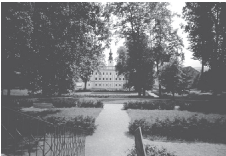
Park pri kaštieli v Markušovciach na Spiši.