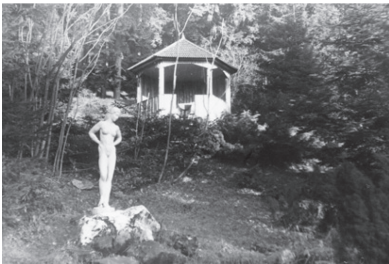
Malá architektúra zvyšuje estetickú hodnotu parku (kúpele Štós).