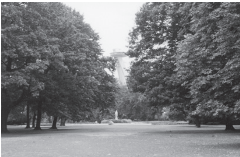
Interiér Sadu Janka Kráľa v Bratislave-Petržalke.

v blízkosti vnútorného mesta bola najznámejšia a najnavštevovanejšia záhrada kniežaťa Pálffyho. Bola založená vo francúzskom štýle a podľa uchovaných dokumentov patrila k najkrajším.