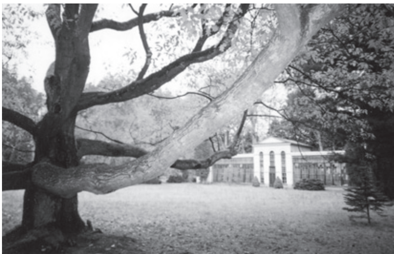
Oranžéria v parku pri kaštieli v Turčianskej Štiavničke.