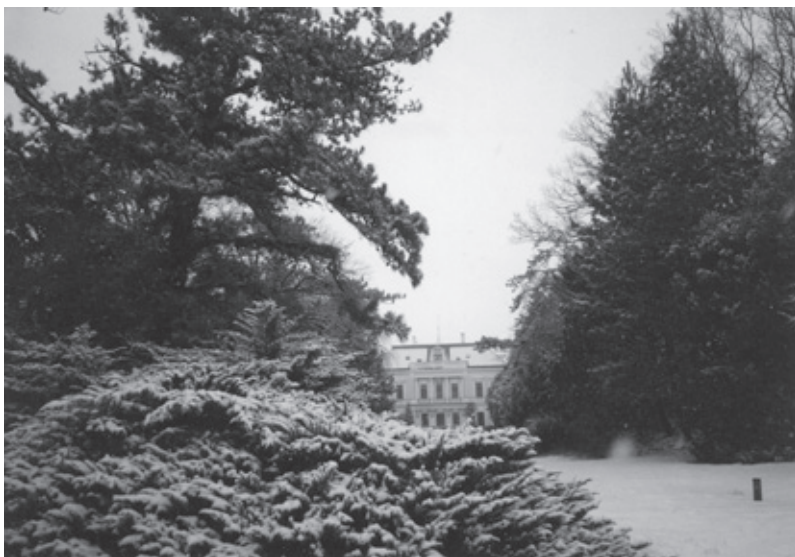
Kompozícia drevín pre zimné obdobie v Arboréte Mlyňany.

a obdĺžniky), vysadené vzorkovanými kobercami kvetín. Bývali ohradené nízkymi plôtikmi, prípadne tvarovanými kríkmi, ale našli sa v nich aj neživé ozdoby, najčastejšie rozmiestnené v rohoch. Tieto záhrady mali zväčša podobu veľkej šachovnice, ako to možno vidieť na obraze Galanty alebo Gabčíkova zo 17. storočia (Güntherová, Steinhübel, 1965).