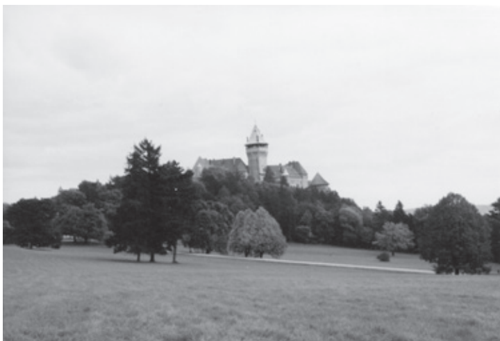
Hore: Pohľad na Smolenický zámok z parku. Dolu: Sadovnícka úprava hornej zámočkej terasy.