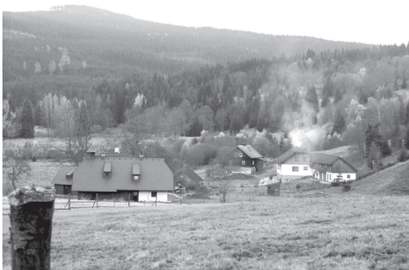
Horské a podhorské oblasti ČR jsou častým cílem amenitních migrantů