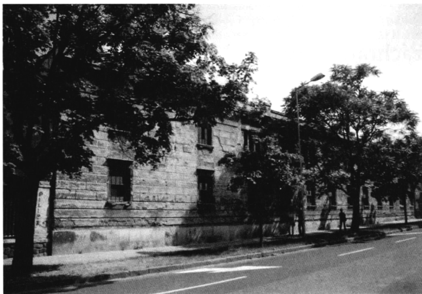
Západná fasáda skladu od Mýtnej ulice.