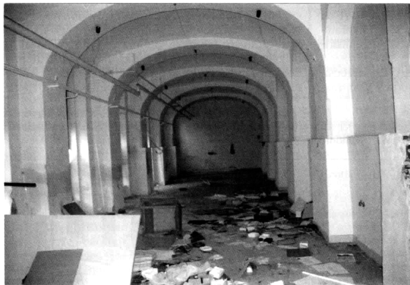
Klenuté prízemie najstaršieho východného krídla.

jednotrakového krídla, ktoré sa napájalo na pôvodné administratívne priestory v najstaršom, východnom krídle. Stredné krídlo tvorila čiastočne podpivničená dvojposchodová trojtraktová budova, ktorá predstavovala najväčší objem v celom areáli továrne. Pozostávala zo štyroch samostatných výrobných