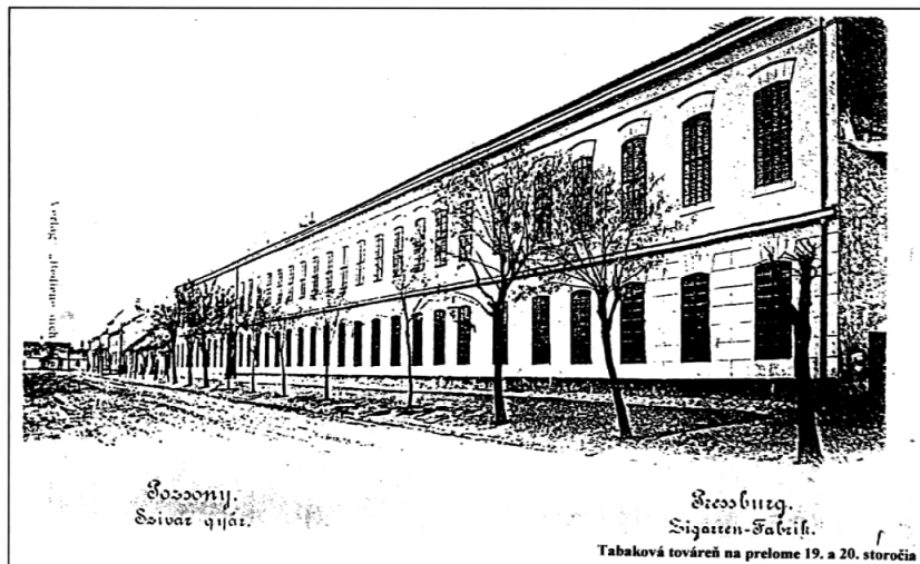
Pohľad na východnú fasádu na Radlinského ulici na prelome 19. a 20. storočia. Dobová pohľadnica

Koncom 80. rokov 19. storočia vyvolal zvýšený dopyt po tabakových výrobkoch potrebu rozšíriť továreň. Bola to najrozsiahlejšia stavebná etapa. V rámci nej sa k severnému krídlu pristavalo nové, v skladbe areálu stredné krídlo, na ktoré sa na juhu na obe strany napojili ďalšie dve kratšie krídla a na severnom konci jedno krátke krídlo smerom na západ. K týmto výrobným priestorom pristavali od Mýtnej ulice prízemné krídla s dielenským a skladovým zázemím. Vznikol tak veľký areál s dvoma vnútornými nádvoriami prepojenými prejazdom v strednom krídle, ktorý sa napriek viacerým úpravám takmer v plnom rozsahu zachoval až do začiatku 21. storočia. Nové krídla sa využívali predovšetkým na výrobné a prevádzkové účely. Administratíva sa obmedzila iba na používanie južného