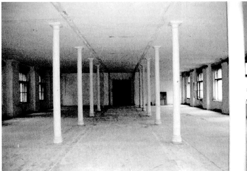
Výrobná hala na poschodí po odstránení priečok.

riéry takmer celého areálu postupne stratili pôvodný charakter.