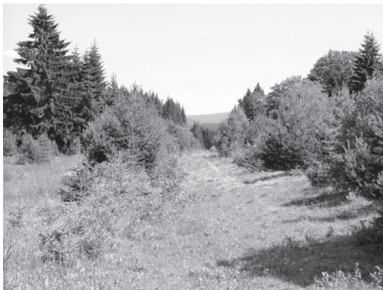
Příroda v místě bývalé železné opony.

Projekt začal inventarizací současného stavu území zeleného pásu. Pro tento účel byla vytvořena společná metodika mapování. Vychází z vizuální interpretace ortorektifikovaných leteckých snímků (s prostorovým rozlišením 0,5 – 3 m) a terénního průzkumu. Základem klasifikačního systému jsou třídy CORINE, již dříve využívané pro klasifikaci území evropských zemí. Výsledky mapování jsou zaneseny do mapy 1: 25 000. Všechny informace (prostorové a atributy) se ve-