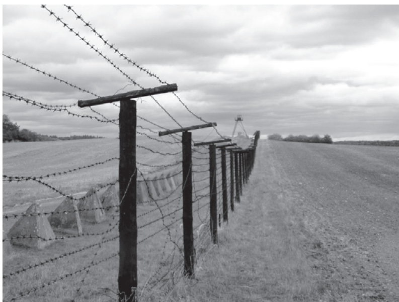
Železná opona byla vnímána jako hranice, kde končil a začínal jiný svět.

skou kampaň na jeho záchranu. Myšlenka zachování tohoto území jako symbolu mezinárodní spolupráce v oblasti ochrany přírody a udržitelného rozvoje – The European Green Belt – byla na světě ( www.greenbelteurope.org ). Zelený pás prochází 22 evropskými zeměmi (obr. na s. 239) v celkové délce 8 500 km. Jeho šířka je značně proměnlivá, od desítek metrů až po několik kilometrů. Tvoří jej převážně lesy blízké přírodním, louky, mokřady, lada, úhory a extenzivně obhospodařovaná zemědělská půda i další biotopy. Z tohoto hlediska nemá v Evropě obdobu. Současně se však zde vyskytují území z pohledu ochrany přírody narušená až silně narušená, technogenní plochy a zemědělsky intenzivně využívaná půda. Propojení izolovaných přírodovědně hodnotných částí by mělo umožnit plynulé šíření rostlin a živočichů. To je hlavním cílem této evropské spolupráce.