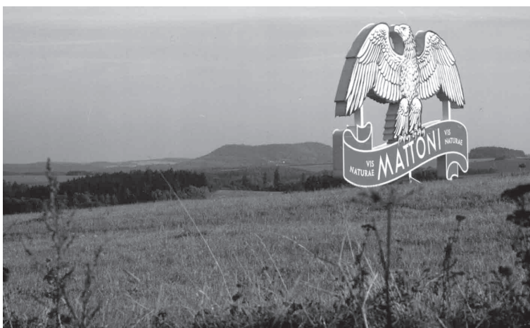
Dnešní dobu charakterizuje absence posvátna – umístění reklamní tabule u posvátné hory Vladař.

Pokud kameny zůstaly i v našem tisíciletí předmětem uctívání prostých lidí, často je církevní vrchnost v rámci boje proti pohanství nechala odvézt nebo zničit. Zcela specifickou kapitolu ničení těchto posvátných míst představuje 20. a počínající 21. století. Nejde jenom o „krajinný holocaust“ v Podkrušnohoří v rámci těžby uhlí, jde především o velkolomy pro těžbu stavebního kamene a vápence. Nejznámějším příkladem je vytěžení unikátní Prokopovy jeskyně v Prokopském údolí, nebo unikátní čedičové Čertovy zdi, která se táhla krajinou od Ještědu po Bezděz. Musíme znova připomenout, že meliorace, zasypávání a převádění pramenů ruší již zmiňované harmonické napětí mezi vrcholy kopců a prameništi v údolích. Značnou ztrátu těchto silových míst zavinilo i vystřelování kamenných