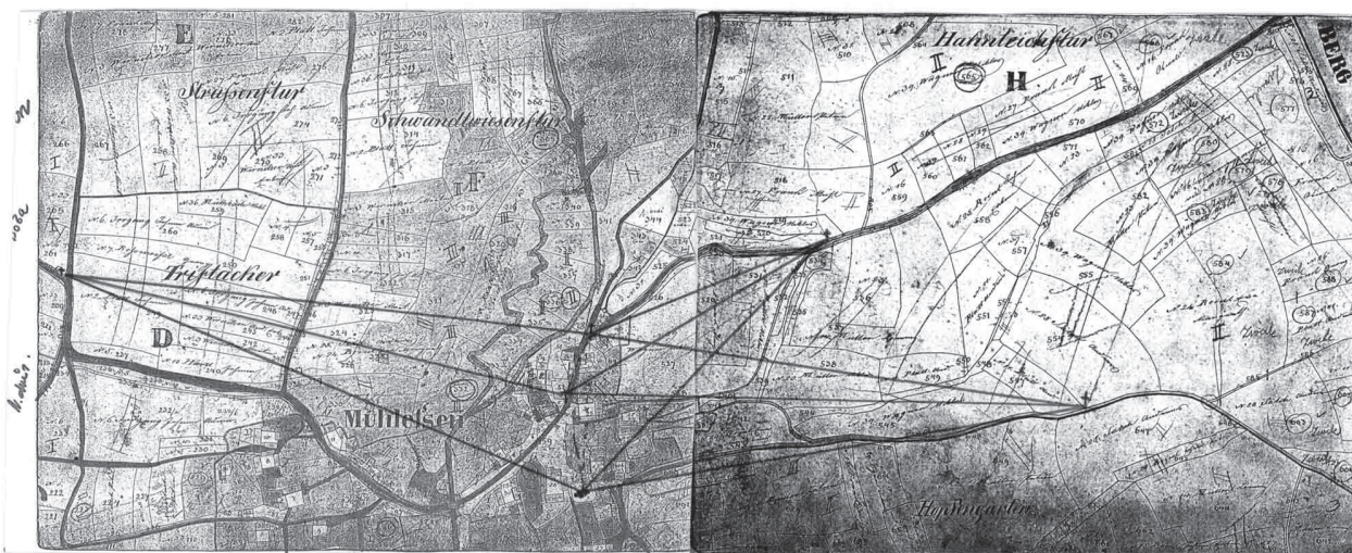
Energie krajiny – Drak v Milhostově. Stav r. 1842. P. Trpák, I. Trpáková, 2001

a krajiny. Obdobný proces jsme zažili v 50. – 70. letech minulého století – „noví lokátoři“ ničí starou sídelní strukturu zakládáním nových struktur.