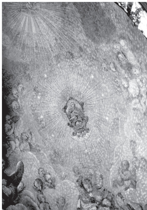
Chlum sv. Maří – energetický bod zrození zašifrovaný do obrazu Panny Marie v kolíbce v kopuli chrámu.

Energetická diskontinualita velkých částí naší dnešní krajiny je velice patrná na již rekultivovaných