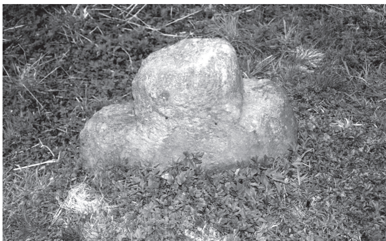
Propadající se kamenný kříž situovaný na energetickém bodu Chlum sv. Maří – Lítov. Posvátná hora Blaník.

mohou mezi sebou navazovat spojení pomocí tzv. energetických linií ( ley lines ). Ty jsou pak určitými vodiči krajinné energie. Vytvoří-li tyto linie na povrchu Země pravidelný geometrický obrazec, je tím energie oblasti zesílena a je-li pozitivní, má také pozitivní vliv na biosféru.