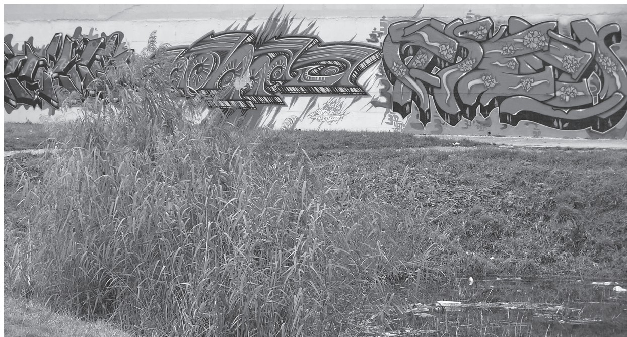
Grafity „zdoobiace“ oporný múr pri Chorvátskom ramene v bratislavskej Petržalke. Foto: I. Imro, 2008

Ing. Mariana Pancíková, Atelier 8000, Vocelova 1, 120 00 Praha 2, m.pancikova@atelier8000.cz