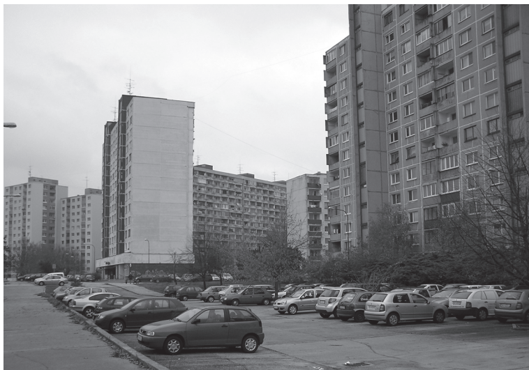
Najväčšie panelákové sídlisko na Slovensku, kde sa namiesto zelených plôch rozrastajú parkoviská a mnohé detské ihriská dávno stratili svoju funkciu. Foto: I. Imro, 2008