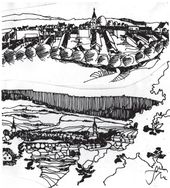
Obr. 1. Siluety vidieckej krajiny, dedina jej súčasťou a dominantou ľudskej prítomnosti je kostol. Autor: Michal Šarafín

nielen územím, ale aj prostredím. Záslužným dielom je súbor definícií vidieka (Hradiská, 2011), kde je vidiek predstavený ako ekonomická kategória založená na parametroch produktívnosti, obývateľnosti a zamestnanosti.