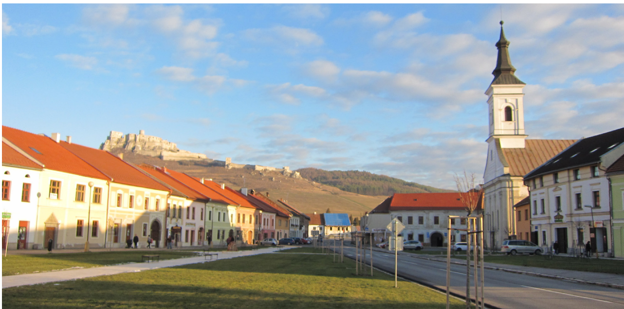
Obr. 1. Pohľad na Spišský hrad zo Spišského Podhradia (2013).

pamiatky, skupiny budov, resp. lokality, ktorá je taká mimoriadna a tak presahuje národné hranice, že je dôležitá pre súčasné a budúce generácie celého ľudstva. Permanentná ochrana tejto lokality, tohto dedičstva, má najvyššiu dôležitosť v medzinárodnej komunite ako celku. Bolo určených 10 kritérií na pridelenie jedinečnej svetovej hodnoty, ktoré sú súčasťou Operačnej príručky implementácie Dohovoru ( Operational Guidelines for the Implementation of the World Heritage Convention , http://whc.unesco.org/en/guidelines ).