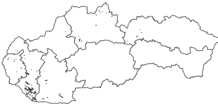
Obr. 1: Priestorové zastúpenie „organických pôd“ prekryv BPEJ pôdny typ 95 s LPIS kultúra OP a TK v rámci Cropland SR.

Pre lepšiu vizualizáciu sú polygóny zobrazené aj s obvodovou líniou, inak by boli na mape kvôli malým plochám nevelmi identifikovateľné, strácali by sa.