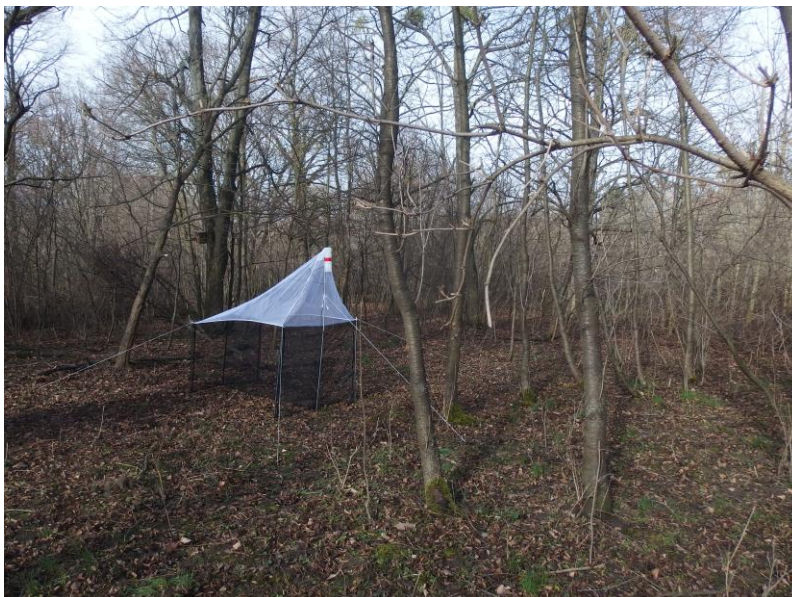
Obr. 3: Expozícia Malasieho pasce v roku 2023 v Jurskom šúri Fig. 3: Exposition of Malasie trap in 2023 in Jurský šúr