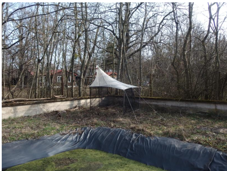
Obr. 2: Malaiseho pasca v zarastenom dubovom lese (Panónsky háj) v Jurskom šúri v roku 2021 a 2024.