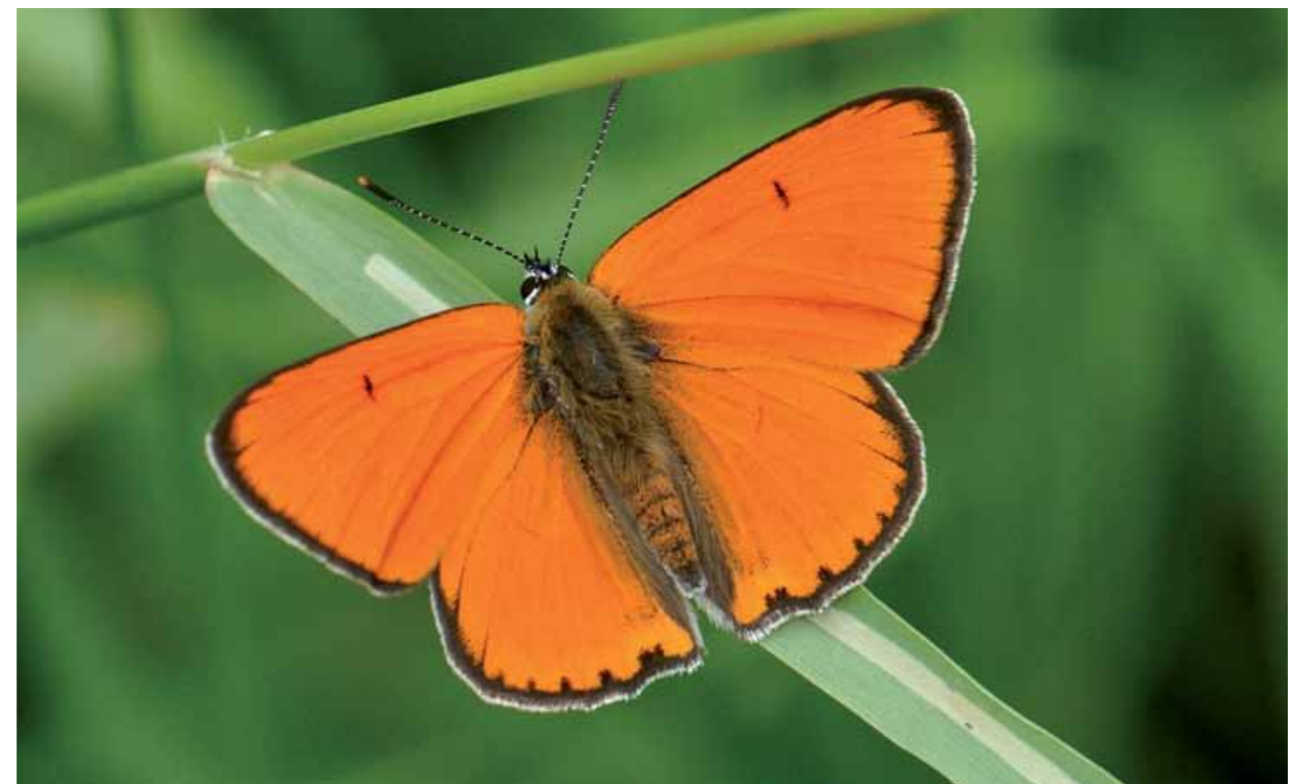
Ohniváček veľký ( Lycaena dispar ), druh európskeho významu, je hojným druhom brehov melioračných kanálov (jún, 2017).