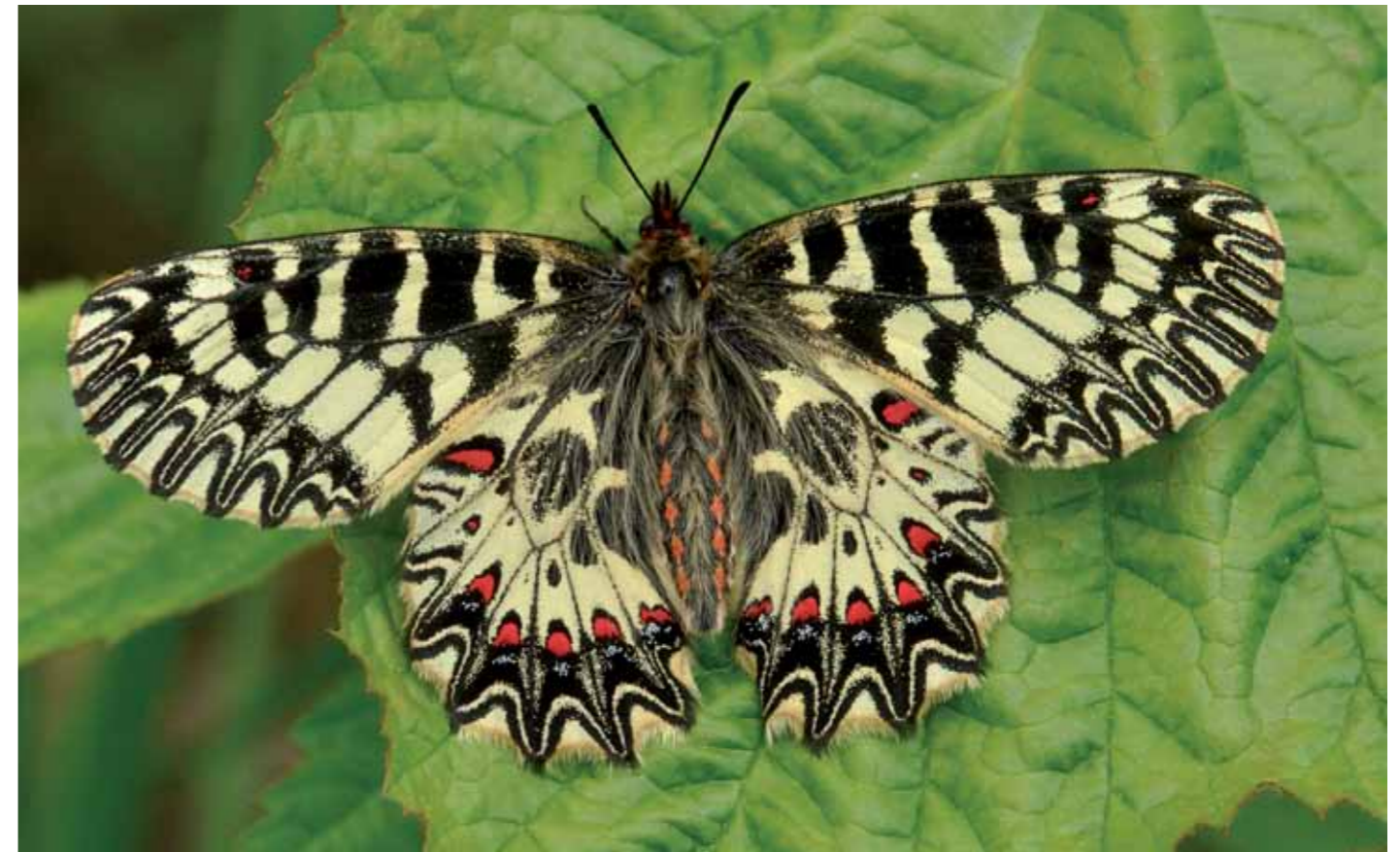
Vzácnemu pestroňovi vlkovcovému ( Zerynthia polyxena ) poskytuje brehová vegetácia kanálov na viacerých miestach vhodné podmienky pre život (jún, 2017).